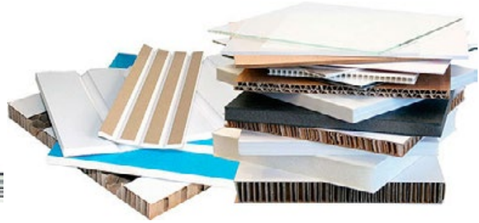
CH-728561 INBLADE 165